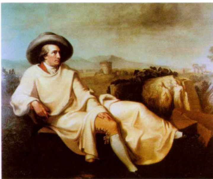
Goethe in het Romeinse landschap (J. H. W. Tischbein, 1786)