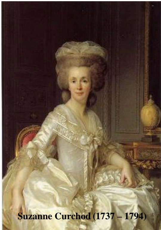
Suzanne Curchod (1737 – 1794)

voorbedachte rade heeft opgezet, om de intellectuele elite van het moment te observeren, te sturen, en een sluier van flou artistique te leggen over het politiek activisme.