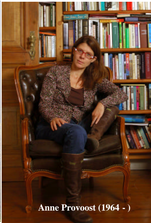
Anne Provoost (1964 - )

In het zwoele salon verdampt de rebellie en ontluikt de idylle: de literatuur an sich was de intellectuele fabriek waarin dit transformatieproces zijn beslag kreeg, en die de Franse Revolutie met glans zou overleven. Tot ver in de 19de eeuw, hét tijdperk van de restauratie en de postrevolutionaire katers, zouden deze hoogburgerlijke kunstconclaven in zwang blijven. Gaandeweg zou de idealistische cultus van de verbeelding overgaan in cynische dédadence en het literaire estheticisme ( l'art pour l'art ) van o.m. Baudelaire, Rimbaud, Verlaine, waaruit dan uiteindelijk zelfs het 20 ste eeuwse surrealisme zou voortkomen, tot en met... de blijde literaire happenings, Saint-Amour, de poëzienachten, of de decadent-exclusieve boekenbals zoals dat van Amsterdam.